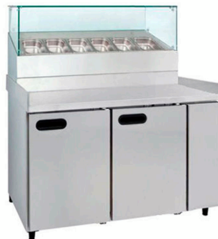
Modelo Normal | Normal Model | Modèle Normal | Modelo Normal