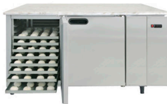
Modelo Normal | Normal Model | Modèle Normal | Modelo Normal