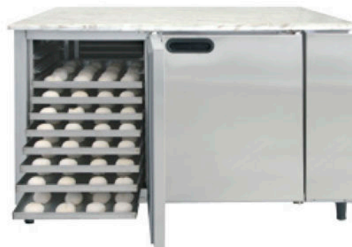
Modelo Normal | Normal Model | Modèle Normal | Modelo Normal