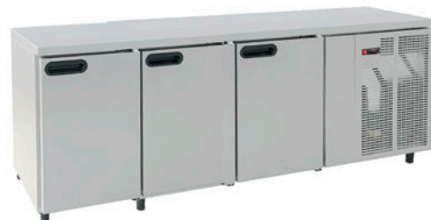
Modelo Normal | Normal Model | Modèle Normal | Modelo Normal